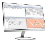
CENTRALE D'ALARMES FELSENMEER