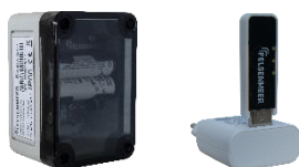
BEACON ECO / CIPOLLINO BEACON