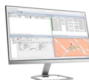
CENTRAL DE ALARMA FELSENMEER